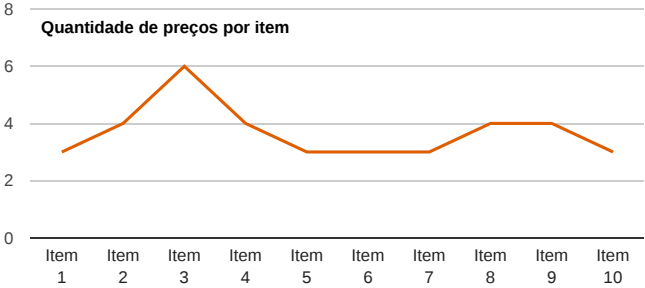
Quantidade de preços por item